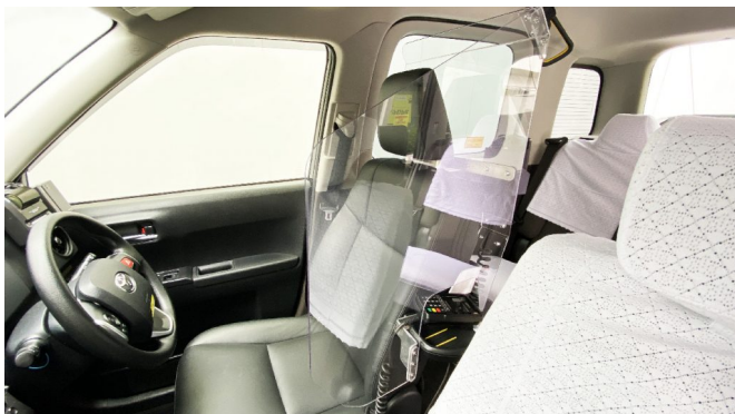
ミラクルガードL (JPNTAXI) 取り付けイメージ

製品詳細： https://www.km-group.co.jp/press/release/2021/2638/