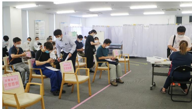
接種待ち・接種後の状態観察の状況