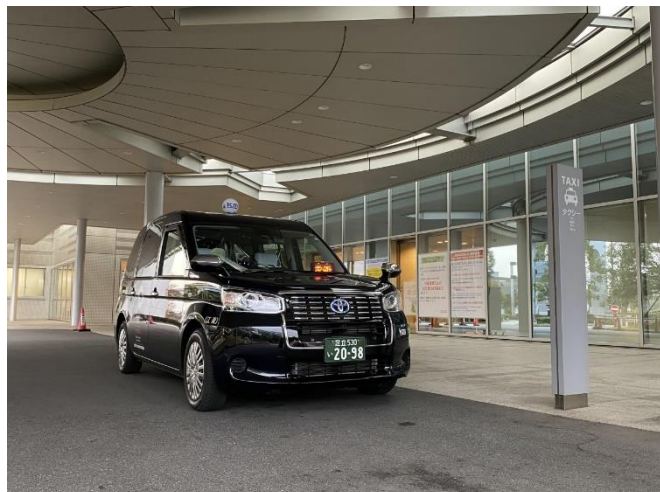
非喫煙ドライバーのみ入構可能なタクシー専用乗り場 (Hospitality Taxi Spot)