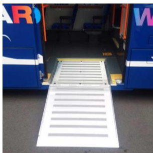
<反転式スロープ板>