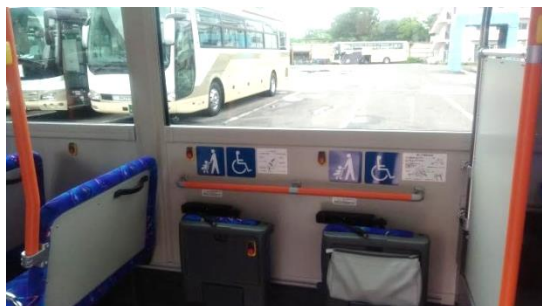
<車いす対応可能なフリースペース>